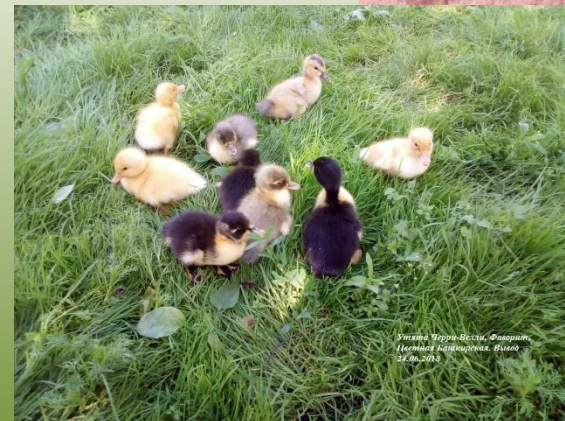
Утята Порода-Белый, Фаворит, Цветная Башкирская. Выращены в 2018 году.