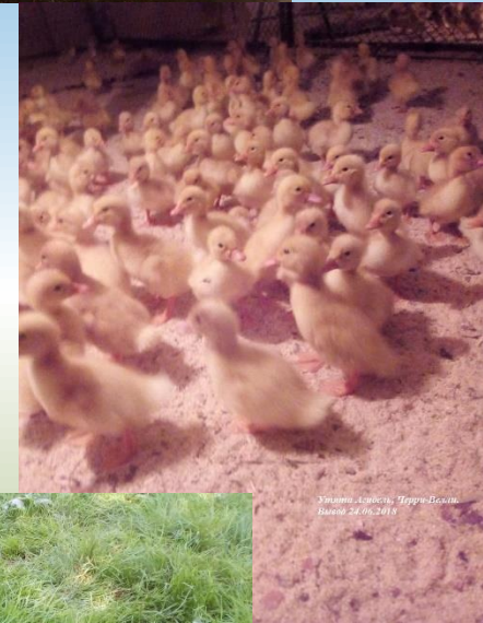
Утиная цыплята, Порода Итальян. Выращены в 2018 году.