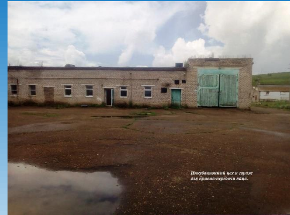
Инкубационный цех и сарай для приема-передачи яиц.