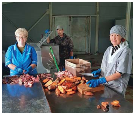
«СЕЛЬСКИЕ УЗОРЫ»-АТЛАС УСПЕШНЫХ ПРАКТИК-2

В планах кооператива заключить договоры с ведомственными организациями, имеющими служебных собак (ГУФСИН, МВД), чтобы заменить их питание сухими импортными кормами на кормление здоровой пищей из натуральных продуктов.