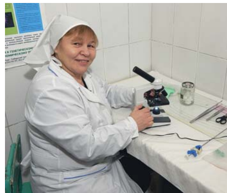
«СЕЛЬСКИЕ УЗОРЫ»-АТЛАС УСПЕШНЫХ ПРАКТИК-2

Искусственное осеменение широко применяется и в тех странах, где исповедуется ислам суннитского или шиитского толка. Ни один из существующих мазхабов не осуждает прогрессивные технологии, если они не причиняют вреда животному, не доставляют ему мучений и служат пользе человека.