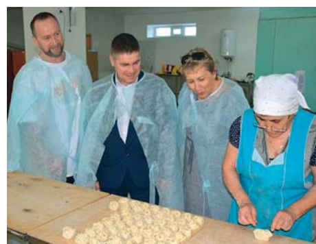
«СЕЛЬСКИЕ УЗОРЫ» • АТЛАС УСПЕШНЫХ ПРАКТИК • 2

В период самоизоляции при коронавирусе кооператив не прекращал доставку продукции жителям региона.