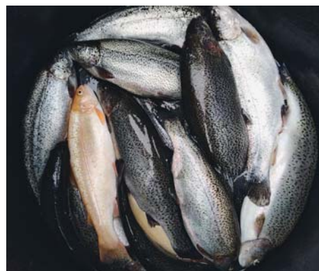
«СЕЛЬСКИЕ УЗОРЫ» • АТЛАС УСПЕШНЫХ ПРАКТИК • 2

На данный момент фермерское хозяйство осуществляет поставки своей продукции в города Екатеринбург (санатории) и Уфа. Работают как с частными заказчиками, так и известными уфимскими ресторанами, такими как «Огни Уфы», «Сыровар», рестораны сети «Тренд», «Главпиво».