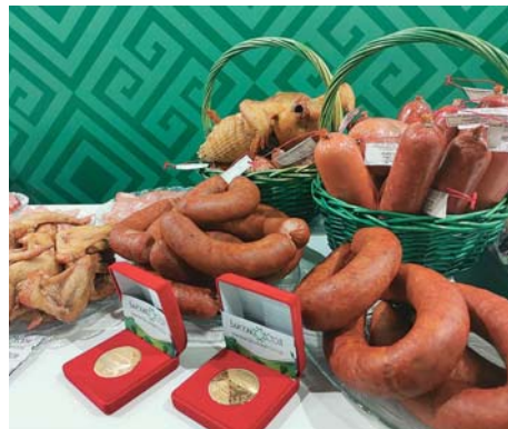
«СЕЛЬСКИЕ УЗОРЫ»•АТЛАС УСПЕШНЫХ ПРАКТИК•2

В 2020 году у кооператива возникла необходимость в приобретении в собственность производственного здания для размещения цеха по производству колбасных изделий и мясных полуфабрикатов, поэтому кооператив принял участие в программе на улучшение материально-технической базы и стал победителем: грант в сумме 2 млн 260 тыс. 800 рублей. Год получения — 2020.