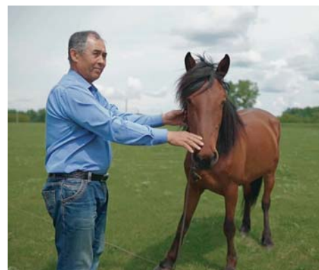
«СЕЛЬСКИЕ УЗОРЫ»•АТЛАС УСПЕШНЫХ ПРАКТИК•2

Выручка КФХ за прошлый год составила 7 млн 600 тыс. рублей.