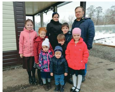
«СЕЛЬСКИЕ УЗОРЫ» • АТЛАС УСПЕШНЫХ ПРАКТИК • 2

В 2025 году планируется производить более 15 тонн земляники садовой (клубники) для клиентов через сеть овощных рынков, сельскохозяйственных ярмарок, индивидуальных заказов, рекламу через социальные сети.