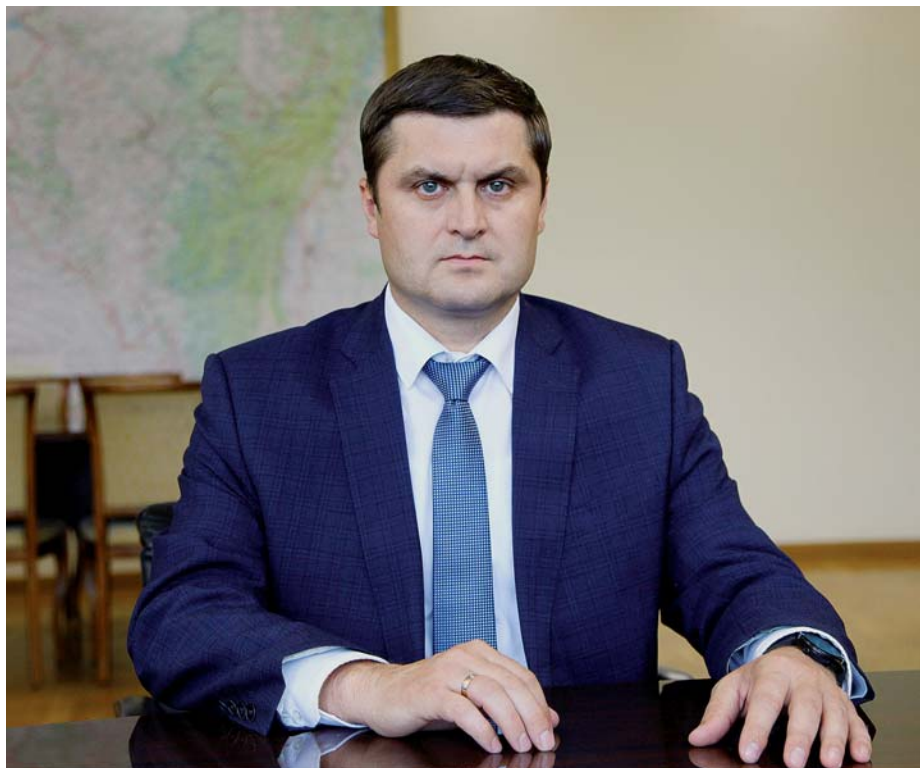
ФАЗРАХМАНОВ Ильшат Ильдусович, заместитель Премьер-министра Правительства Республики Башкортостан – министр сельского хозяйства Республики Башкортостан

Р оль агропромышленного комплекса в экономической, социальной жизни нашего общества, безусловно, очень велика. Не будет преувеличением сказать, что от уровня его развития в значительной степени зависит социальное благополучие и качество жизни граждан нашей республики.