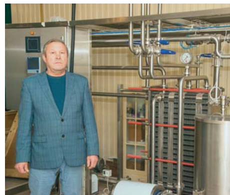
«СЕЛЬСКИЕ УЗОРЫ» • АТЛАС УСПЕШНЫХ ПРАКТИК • 2

Дальнейшее развитие кооператива подтолкнуло заняться переработкой молока. «Исток» подал документы на получение гранта по программе реализации ДГП, основанных на инициативах граждан. Кооператив стал обладателем гранта, эти средства направлены на приобретение технологического оборудования по переработке молока. Часть этой суммы, порядка 700 тыс. рублей, вложили пайщики кооператива. В планах — стать молочным перерабатывающим предприятием с развитой материально-технической базой.