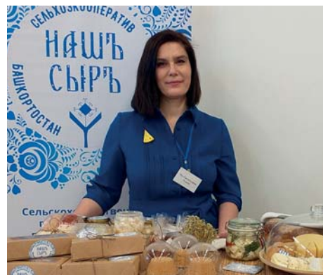
«СЕЛЬСКИЕ УЗОРЫ» • АТЛАС УСПЕШНЫХ ПРАКТИК • 2

В период пандемии кооператив обеспечивал население и близлежащие территории г. Уфы продуктами питания с использованием онлайн-площадки приема заказов.