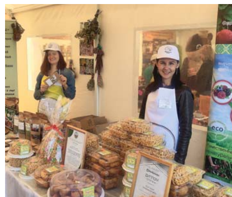
«СЕЛЬСКИЕ УЗОРЫ» • АТЛАС УСПЕШНЫХ ПРАКТИК • 2

Общая площадь клубники на членов кооператива составляет более трех гектаров.